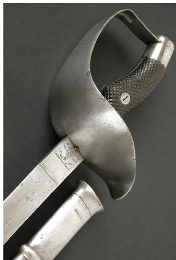
SABLE Tropas de Institutos Montados modelo 1895 Libro ESPADAS ESPAÑOLAS, MILITARES Y CIVILES. Pág.344