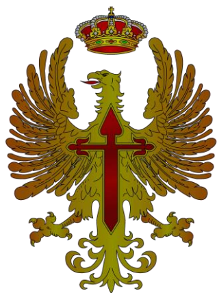
Emblema del Ejército Águila con corona real y cruz espada de Santiago.

Llevan un CETME modelo C 1964 armado con un cuchillo-bayoneta modelo C 1969. Guarnición corta en cruz y con ojo para la bocacha del fusil, puño de pasta negra, hoja con bigotera y filo corrido al exterior con leve curvatura, vaina de plástico de color verde y negra con su propio tahalí y en la punta un cordón para sujetarlo al muslo.