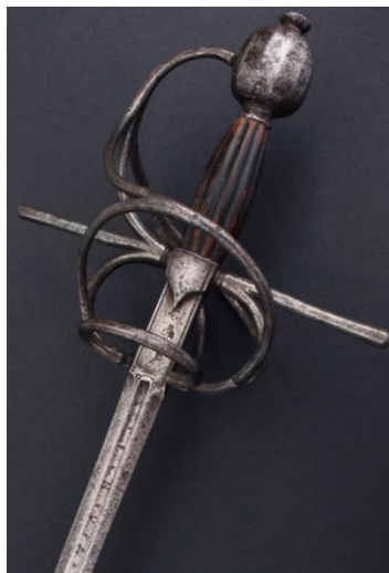
ESPADA DE LAZO "Johanes de la Horta" Siglo XVI Libro ESPADAS ESPAÑOLAS, MILITARES Y CIVILES. Pág. 24