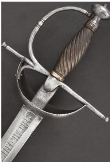
ESPADA Siglo XVIII

Libro ESPADAS ESPAÑOLAS, MILITARES Y CIVILES. Pág. 104