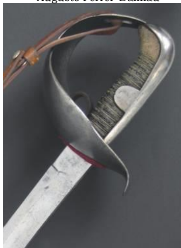
SABLE Tropa Caballería Ligera modelo 1860 Libro ESPADAS ESPAÑOLAS, MILITARES Y CIVILES. Pág. 317