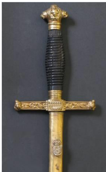
ESPADÍN Libro ESPADAS ESPAÑOLAS, MILITARES Y CIVILES.