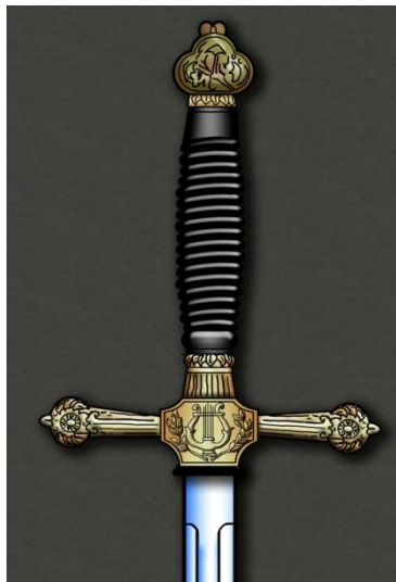
ESPADÍN Músico Mayor hacia 1901 Libro ESPADAS ESPAÑOLAS, MILITARES Y CIVILES. Pág. 205