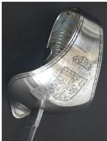
SABLE Para oficial de Caballería, modelo 1878 Libro ESPADAS ESPAÑOLAS, MILITARES Y CIVILES. Pág. 327