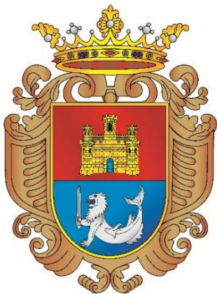
Escudo de la ciudad de Manila

Van armados con una carabina Rémington modelo 1873 y un sable modelo 1860 para tropa de Caballería reformado en 1888. Guarnición de acero con cazoleta cerrada a la prusiana, monterilla corrida con orejetas, puño de madera forrado de piel y alambrado, hoja curva, vaina de hierro con una sola abrazadera y dos anillas.