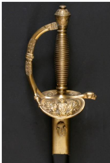
ESPADA DE CEÑIR Jefes y oficiales de Infantería modelo 1867 Libro ESPADAS ESPAÑOLAS, MILITARES Y CIVILES. Pág. 180