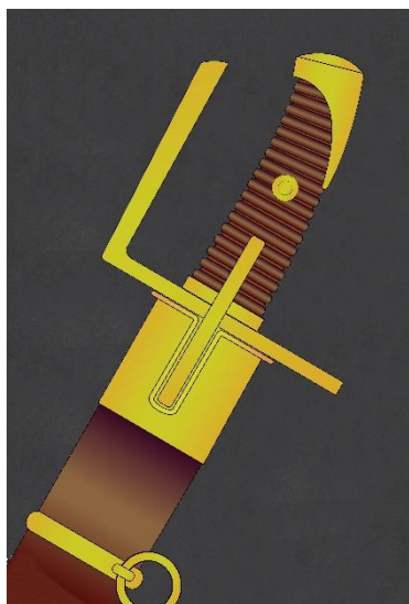
SABLE Regimiento de Húsares circa 1700 (ilustración)