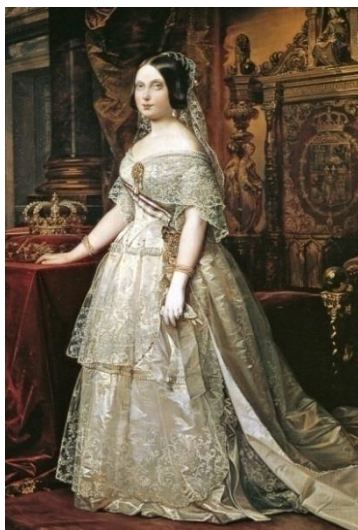
S.M la reina Isabel II

La espada de montar que luce en el cinto es el modelo 1816 para oficial de la Guardia. Guarnición de latón sobredorado, tres gavilanes y aro que se unen en la monterilla, el puño es de ébano con gallones y alambrado de hilo de cobre. Hoja recta y vaina de hierro con dos anillas.