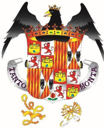
Armas de Los Reyes Católicos

Utilizaban seguramente una espada de dos manos con hoja recta y dos filos. En esta época la guarnición sería sencilla, con gavilanes rectos o un poco curvados. También llevaban en algunos casos alguna otra protección para la mano, como patillas o pitones. El puño largo, gallonado forrado de tela o alambrado, terminado con un notable pomo que le servía de contrapeso. La vaina de cuero con aparejos metálicos.