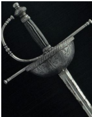
ESPADA DE TAZA "Antonio en Toledo" Siglo XVII

Llevan una alabarda que da nombre al Cuerpo y una espada que podría ser de lazo, de conchas o de taza como las aquí presentadas. En la época de los Austrias estos tres tipos de guarnición se utilizaron simultáneamente y en muchas ocasiones haciendo pareja con una daga de mano izquierda, también llamada de misericordia.