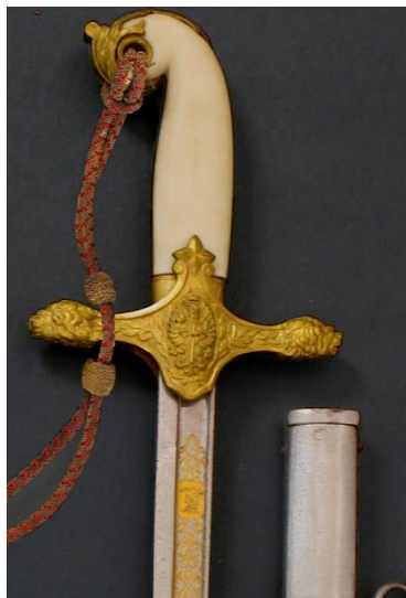
ESPADA-SABLE P.S. Oficial General modelo 1943 Libro ESPADAS ESPAÑOLAS, MILITARES Y CIVILES. Pág. 244