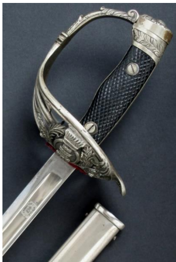
ESPADAS-SABLE P.S. Oficial de Ingenieros Libro ESPADAS ESPAÑOLAS, MILITARES Y CIVILES. Pág. 233