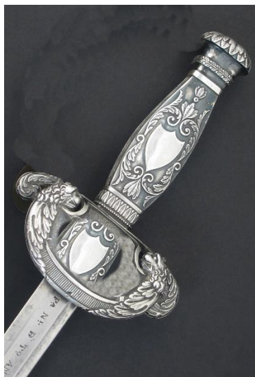
ESPADA DE CEÑIR A capricho Libro ESPADAS ESPAÑOLAS, MILITARES Y CIVILES. Suplemento