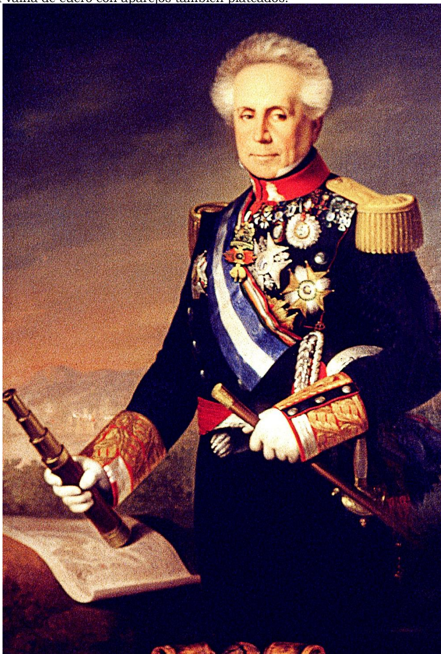
Óleo del Museo del Ejército