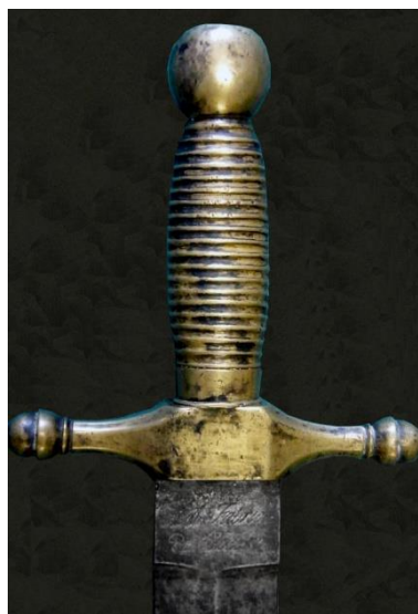
MACHETE Tropa de Zapadores Modelo 1826 Libro ESPADAS ESPAÑOLAS, MILITARES Y CIVILES. Pág. 371