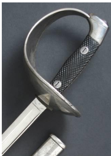
ESPADA-SABLE P.S. Para oficial de Caballería modelo 1908 Libro ESPADAS ESPAÑOLAS, MILITARES Y CIVILES. Pág. 212