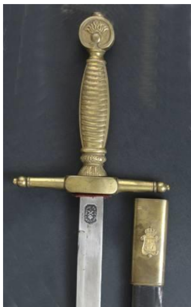
MACHETE Músicos Militares modelo 1879 Libro ESPADAS ESPAÑOLAS, MILITARES Y CIVILES. Pág. 397