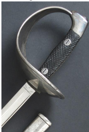
ESPADA-SABLE P.S. Oficial de Caballería, modelo 1908 Libro ESPADAS ESPAÑOLAS, MILITARES Y CIVILES. Pág. 212