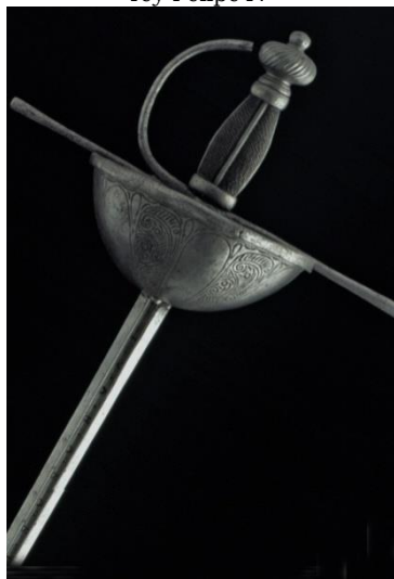
ESPADA DE TAZA