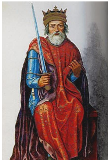
Fernando III el Santo, patrón de Ingenieros

El sable que aparece en el óleo no es reglamentario sino de los llamados "a capricho" y por ese motivo es a veces difícil de encontrar uno igual. El sable de la foto inferior no es como el que lleva el Coronel en el óleo, pero perfectamente pudo haberlo lucido en su época.