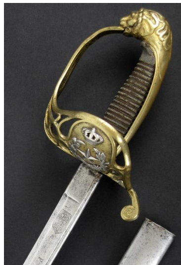
ESPADA DE MONTAR oficial de Estado Mayor modelo 1861 Libro ESPADAS ESPAÑOLAS, MILITARES Y CIVILES. Pág. 177