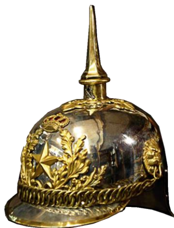
Casco de Estado Mayor Colección de José Miguel Gallego

Luce una espada de montar para oficiales del Estado Mayor modelo 1861. Guarnición de latón dorado, en la guarda el emblema del Cuerpo, la monterilla corrida formada por una cabeza de león y puño de piel alambrado con hilo de cobre. La hoja recta y vaina de hierro con una abrazadera y su correspondiente anilla.