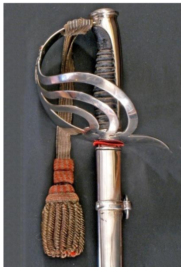
ESPADA DE MONTAR para oficial del Escuadrón de la Escolta Real, modelo 1875 Libro ESPADAS ESPAÑOLAS, MILITARES Y CIVILES. Pág. 190