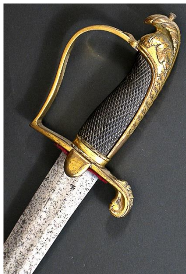
ESPADA Para oficiales hacia 1800 Libro ESPADAS ESPAÑOLAS, MILITARES Y CIVILES. Pág. 123