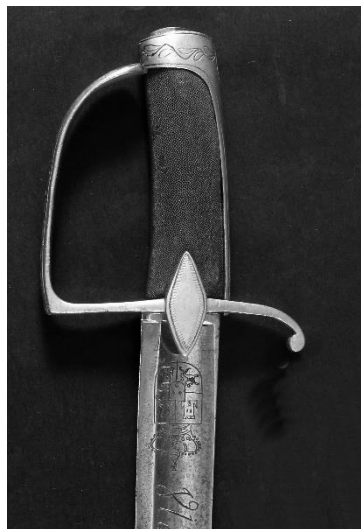
SABLE Para oficial Libro ESPADAS ESPAÑOLAS, MILITARES Y CIVILES. Pág. 262