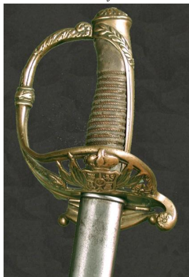
SABLE Jefes y oficiales de Infantería hacia 1851 Libro ESPADAS ESPAÑOLAS, MILITARES Y CIVILES. Pág. 307