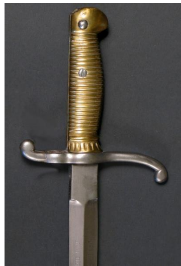
ESPADA BAYONETA Guardia Amadeo I modelo 1871

Libro ESPADAS ESPAÑOLAS, MILITARES Y CIVILES.