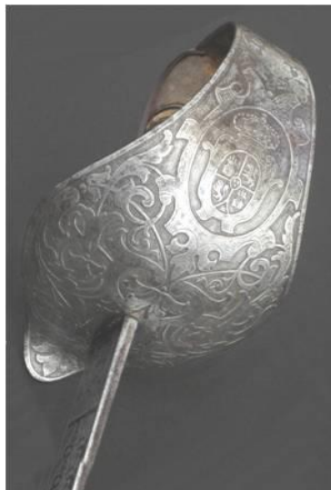
SABLE Oficial Caballería Ligera, hacia 1860 Libro ESPADAS ESPAÑOLAS, MILITARES Y CIVILES. Pág. 319