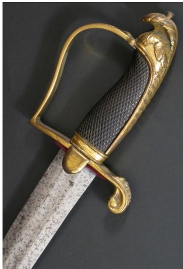
SABLE hacia 1803

Libro ESPADAS ESPAÑOLAS, MILITARES Y CIVILES. Pág. 81