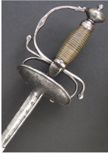
ESPADA DE CONCHAS "Toledo"

Luce una espada de ceñir similar a la de la foto superior, con guarnición formada por dos cazoletas de acero, gavilanes vueltos, guardamano, puño alambrado, escusón, recazo y hoja recta.