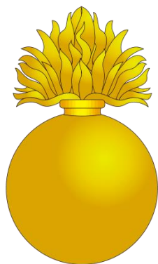
Emblema de cuello para Artillería

En esta época uno de los sables mas habituales era el llamado de guarnición de estribo. El guardamano, gavilán, pomo y guía de latón dorado, siendo el puño de madera de ébano con gallones. La hoja curva y la vaina de latón dorado también con dos abrazaderas y sus correspondientes anillas.