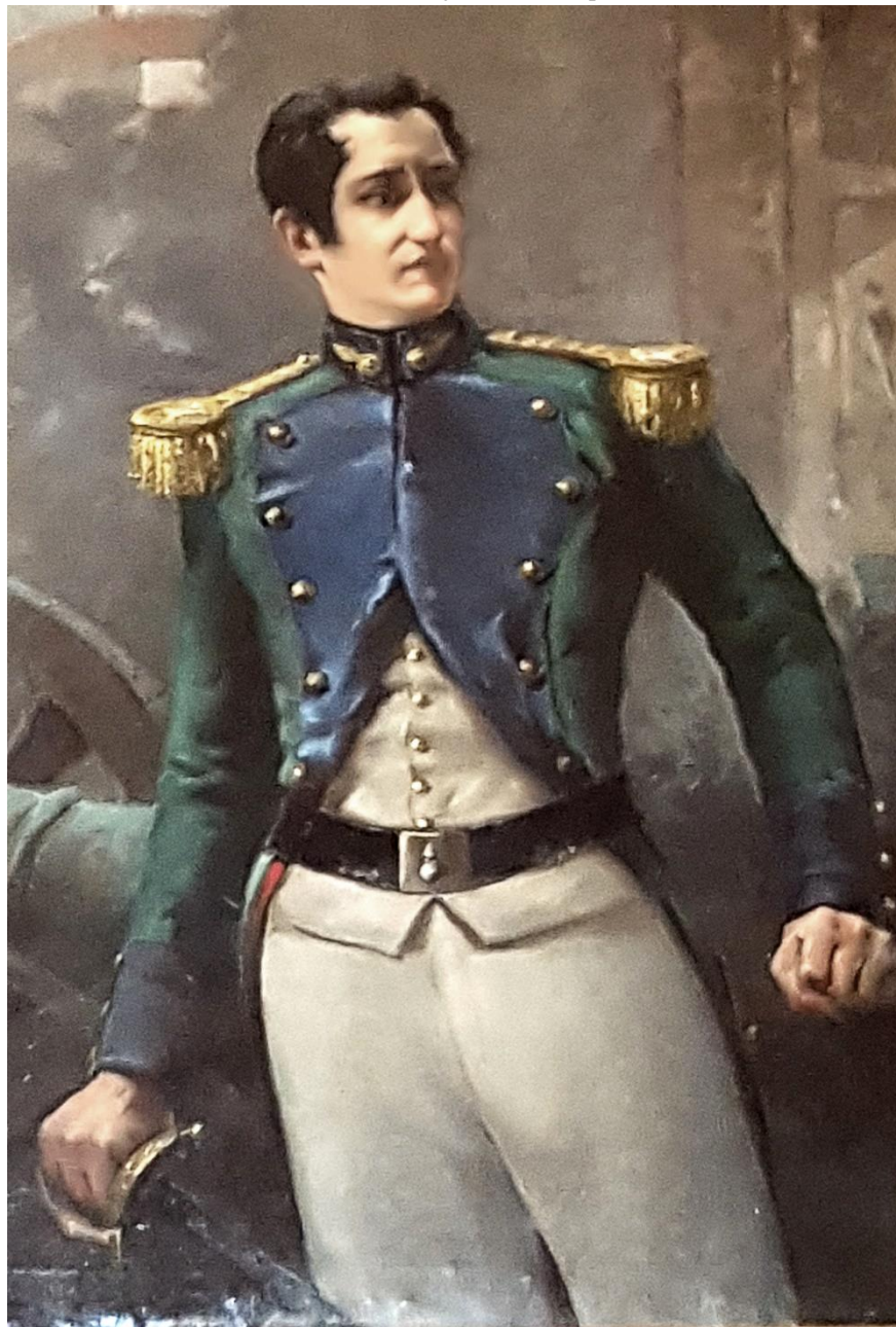
Oleo de la Academia de Artillería de Segovia