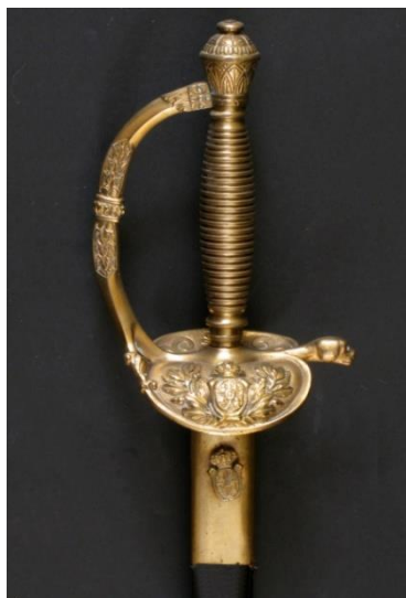
ESPADA DE CEÑIR Jefes y oficiales de Infantería modelo 1867 Libro ESPADAS ESPAÑOLAS, MILITARES Y CIVILES. Pág. 180