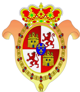
Armas de S.M. el rey Carlos IV

El sable característico de los ligeros de 1803. Hoja curva, vaina de latón dorado con guías y dos anillas, la guarnición de las llamadas de estribo, de latón dorado también y puño de asta.