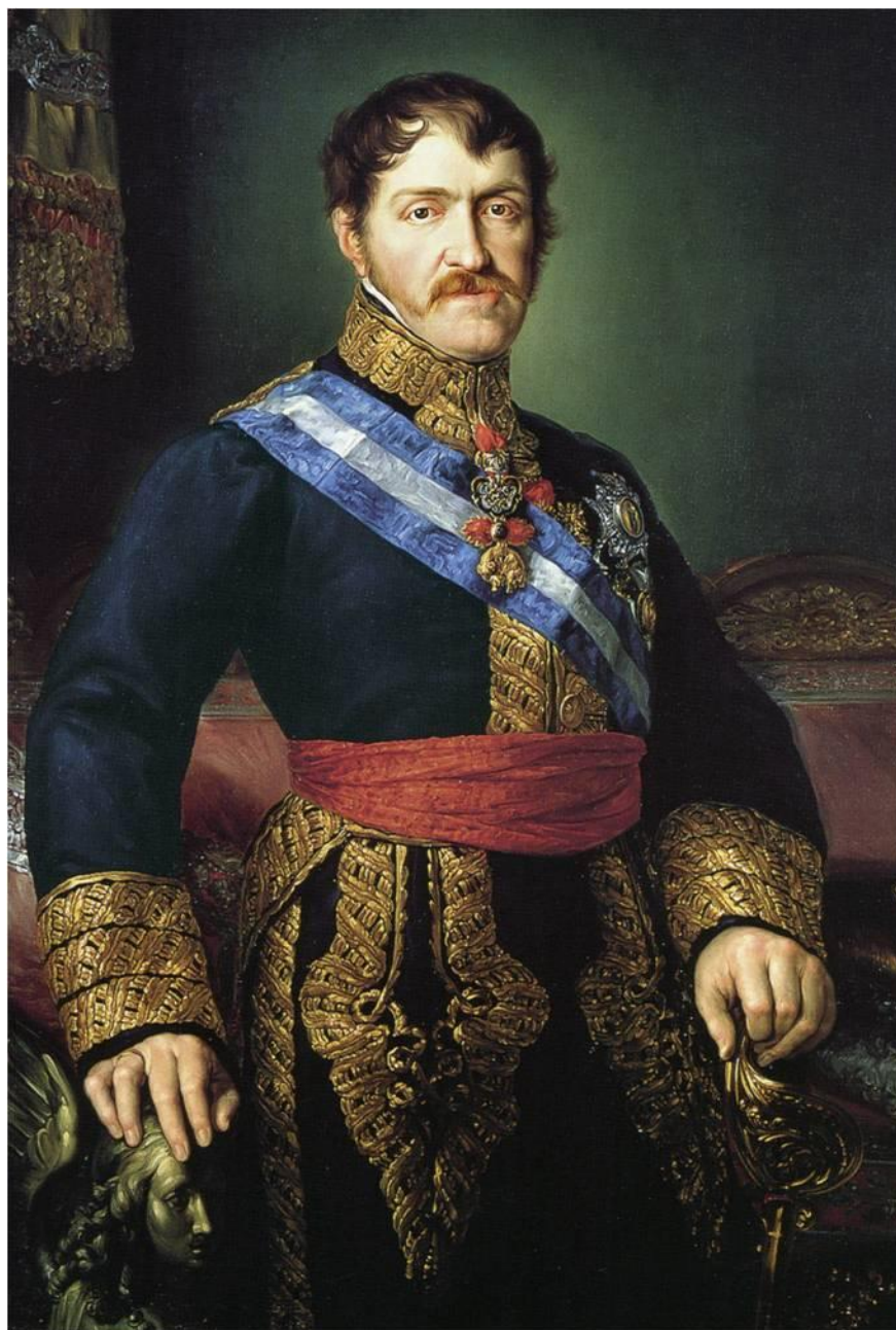
"Retrato de D. Carlos María Isidro de Borbón" Oleo pintado por Vicente López. (Real Academia de Bellas Artes de San Fernando.)