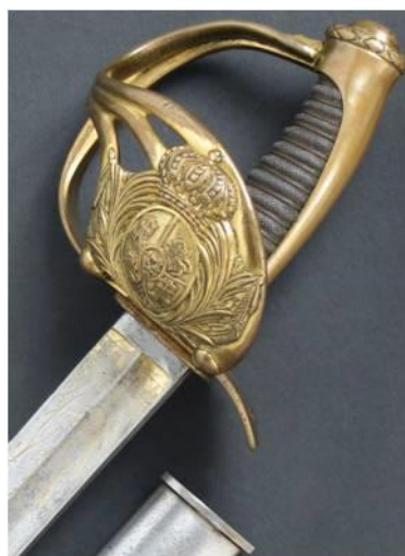
SABLE hacia 1825 Libro ESPADAS ESPAÑOLAS. MILITARES Y CIVILES. Pág. 285