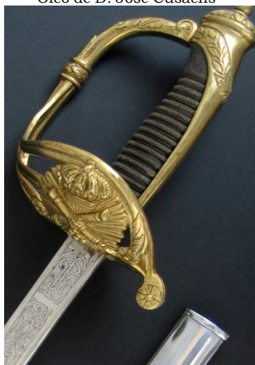
SABLE Jefes y oficiales de Artillería modelo 1862 Libro ESPADAS ESPAÑOLAS, MILITARES Y CIVILES. Pág. 324