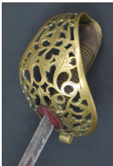
SABLE Oficial de Caballería, modelo 1840 Libro ESPADAS ESPAÑOLAS, MILITARES Y CIVILES. Pág. 300