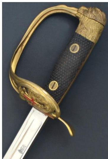
ESPADA-SABLE P.S. Jefes y oficiales modelo 1943 Libro ESPADAS ESPAÑOLAS, MILITARES Y CIVILES. Pág. 246