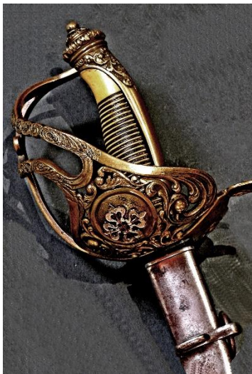
ESPADA-SABLE Caballero de la Orden de Alcántara hacia 1870 Libro ESPADAS ESPAÑOLAS, MILITARES Y CIVILES: Pág. 450