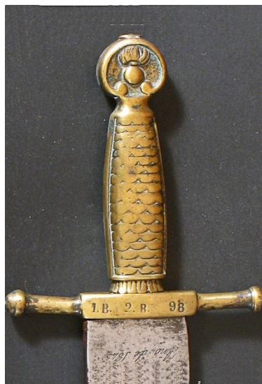
MACHETE Artillería e Ingenieros modelo 1843 Libro ESPADAS ESPAÑOLAS, MILITARES Y CIVILES. Pág. 375