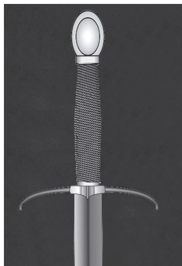
ESPADA DE DOS MANOS