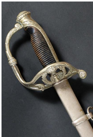
SABLE Oficial de Ingenieros modelo 1860 Libro ESPADAS ESPAÑOLAS, MILITARES Y CIVILES. Pág. 322