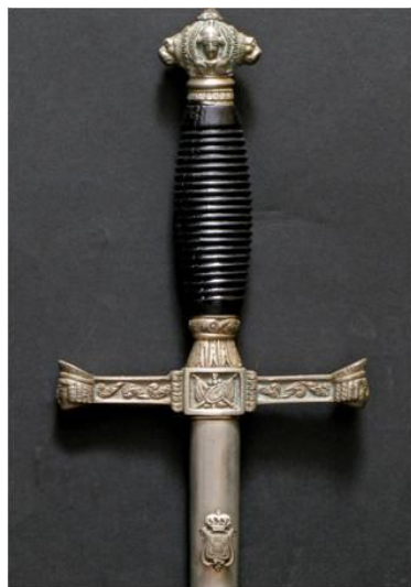
ESPADAS DE CEÑIR Oficial de Caballería, modelo 1851 Libro ESPADAS ESPAÑOLAS, MILITARES Y CIVILES. Pág. 170