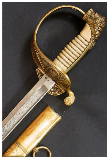
ESPADA-SABLE Jefes y oficiales de la Armada modelo 1844 variante con hoja recta P.S. Libro ESPADAS ESPAÑOLAS, MILITARES Y CIVILES. Pág. 228