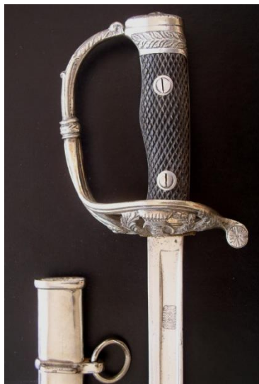
ESPADA-SABLE P.S. Oficial Ingenieros Libro ESPADAS ESPAÑOLAS, MILITARES Y CIVILES. Pág. 232