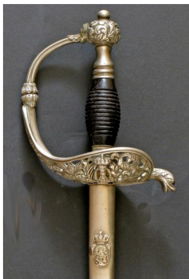
ESPADA DE CEÑIR oficial del Cuerpo de Ingenieros modelo 1860 Libro ESPADAS ESPAÑOLAS, MILITARES Y CIVILES. Pág. 174