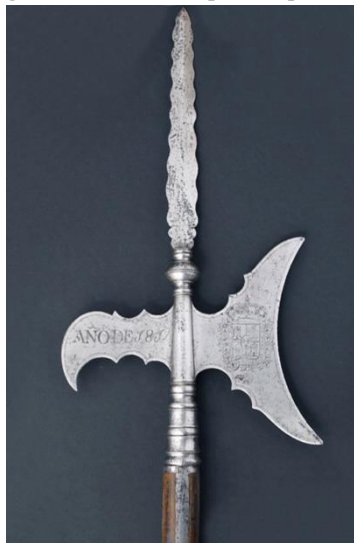
Alabarda del reinado de Fernando VII

La espada seguía siendo, como desde finales del siglo XVIII, de cazoleta de barquilla, que es la espada característica de los Alabarderos. Guarnición de acero, cazoleta de barquilla con guarda, gavilanes rectos, pomo, puño alambrado con hierro, recazo y hoja recta.