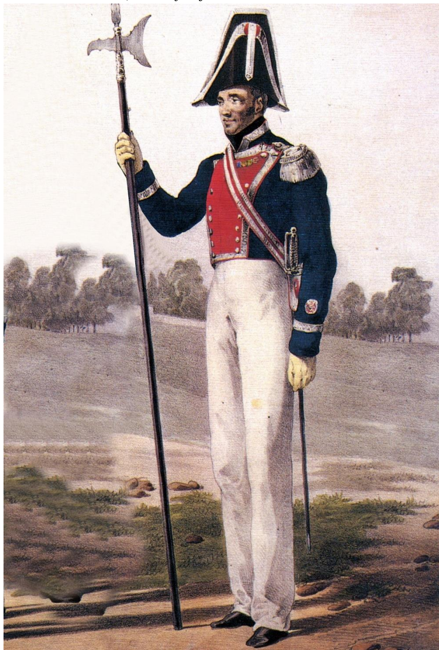
Ilustración de la colección del Marqués de Zambrano