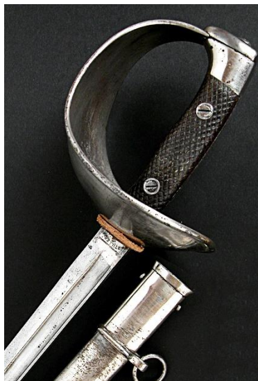
ESPADA-SABLE P.S. Para tropa de Caballería modelo 1907-18 Libro ESPADAS ESPAÑOLAS, por Vicente Toledo