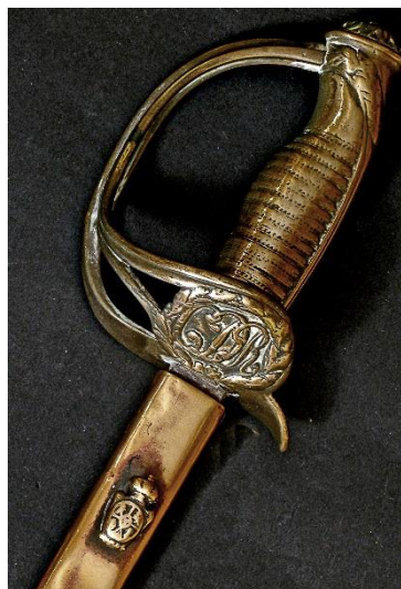
SABLE Sargentos Cuerpo de Carabineros del Reino modelo 1876 Libro ESPADAS ESPAÑOLAS, MILITARES Y CIVILES.